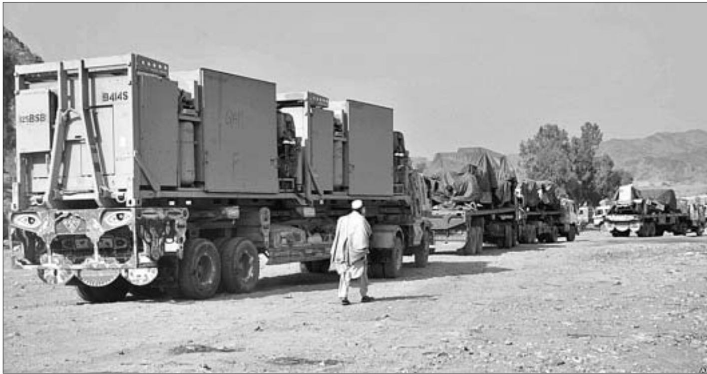
Посля таго як Пакістан закрыў амерыканскім войскам транзіт армейскіх грузаў па сваёй тэрыторыі, на мяжы ўтварылася кіла-метровая чарга.

Работать придется дольше, получать на выходе — меньше. Сообщая народу о таких драконовских мерах, министр социального развития расплакалась.