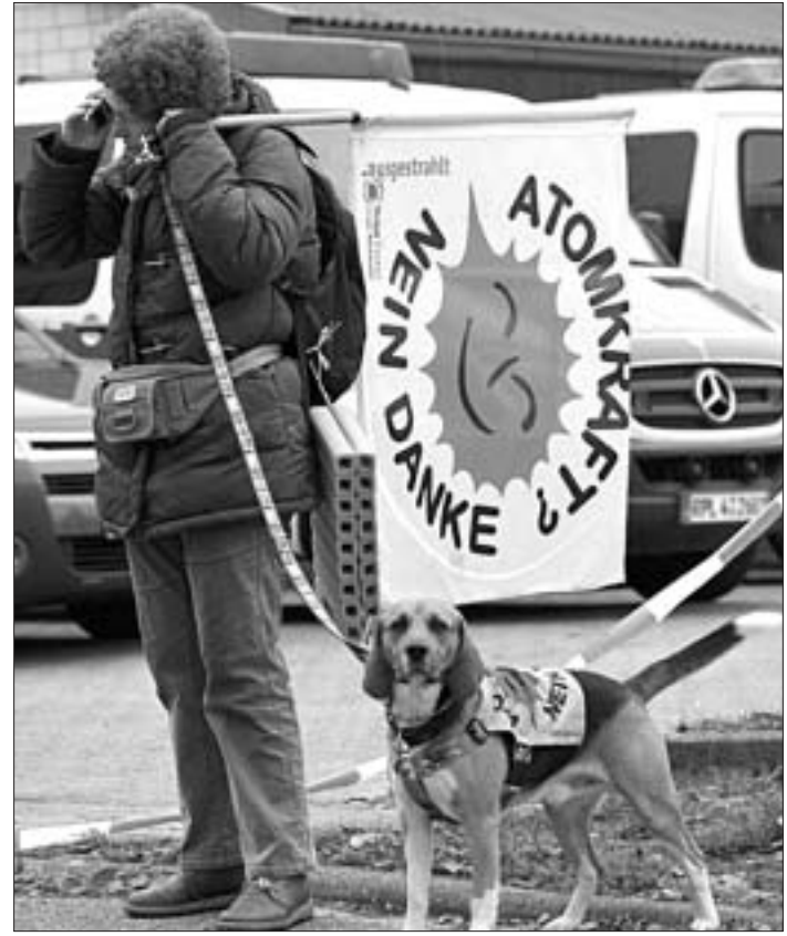
На здымку: Акцыя пратэсту супраць атамнай энергіі ў Германіі, у якой «удзельнічалі» нават сабакі.

Апытанне грамадскай думкі, праведзенае сумесна Бі-Бі-Сі і арганізацыяй GlobeScan, паказвае, што атаманая энергетыка выклікае неспакій сярод насельніцтва большасці краін. Жыхары краін, у якіх вядуцца ядзерныя праграмы, зараз ставяцца да іх больш адмоўна, чым у 2005 годзе, калі праводзілася апошняе падобнае апытанне. Большасць насельніцтва планеты лічыць, што можна абысціся без атама за кошт узаўмяляемых крыніц энергіі і павышэння эфектыўнасці. У цэлым толькі 22 працэнта апытаных згадзіліся з тым, што атаманая энергетыка з'яўляецца бяспечнай і важнай крыніцай электраэнергіі, таму неабходна бу-