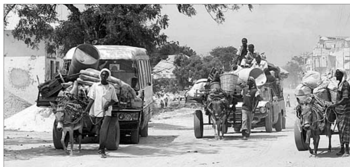
Сабрайшы свае пажыткі, жыхары раёна Дайніл у Самалі бягуць далей ад дому, дзе ўспыхнулі сутыкненні паміж урадавымі войскамі і ісламісцкімі баевікамі.