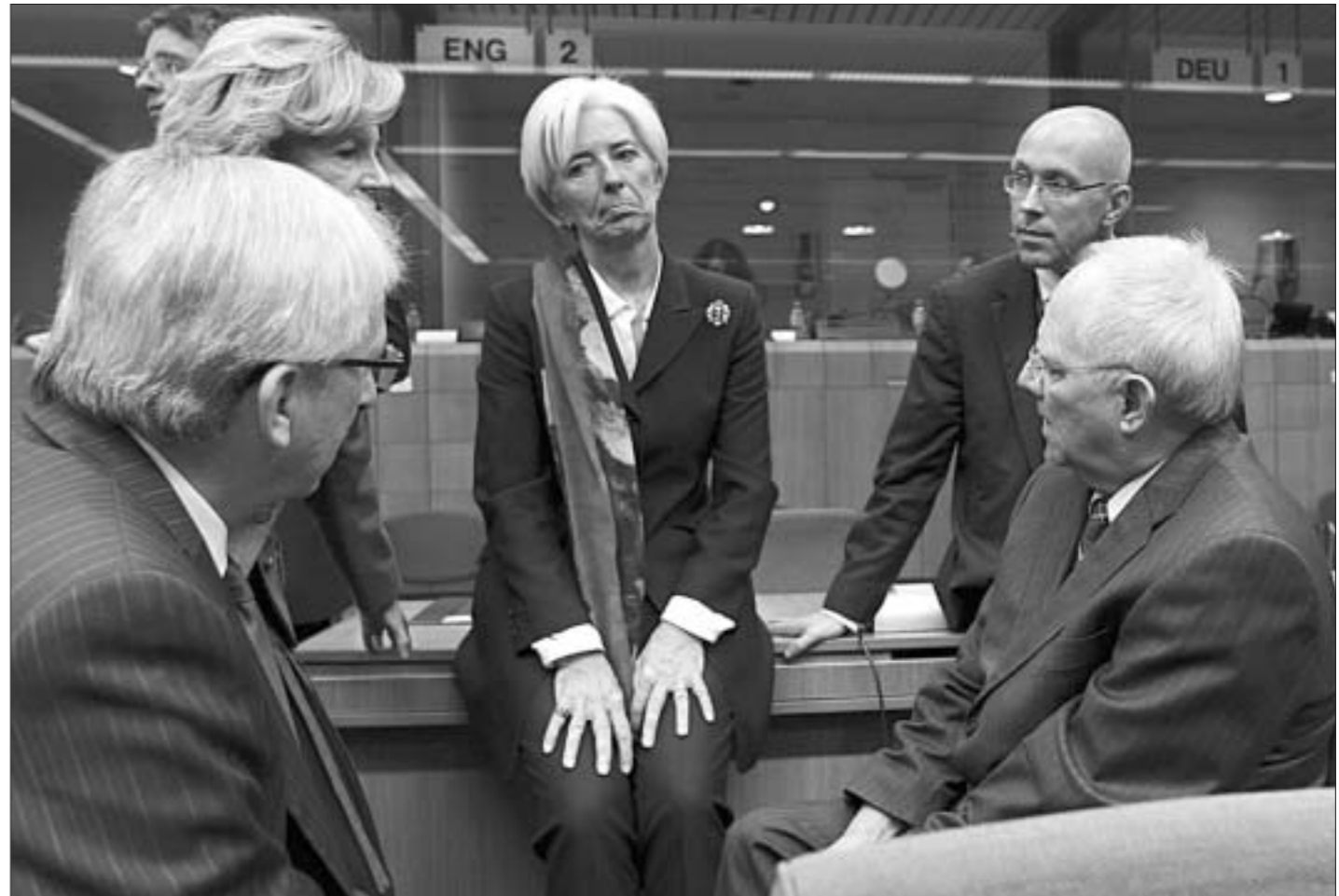
Учора до чотирьох гадзін раніци праяцяваўся саміт Еўрапейскага Саюза. У выніку быў прыняты антыкрызісны план для Еўропы. Згодна з ім, Грэцыя атрымае 100 мільярдаў еўра фінансавай падтрымкі ад ЕС і МВФ у рамках рэструктурызацыі даўгоў. Больш за тое, даўгі гэтай самай праблемнай краіны Еўрасаюза могуць быць спісаны амаль на 50 працэнтаў.

Опасения основаны на том, что наплыв более дешевой рабочей силы может вытеснить немецких и австрийских трудящихся. По крайней мере в Польше действительно отмечают резкий рост количества желающих изучать немецкий язык.