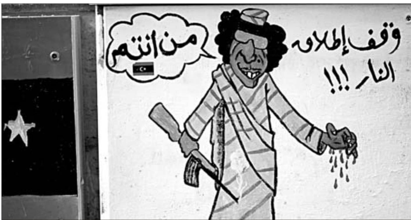
На сценах будынкаў у Бенгазі з'явіліся карыкатуры, якія высмейваюць былога дыктара Муамара Кадафі.

В настоящий момент премьер-министр Японии получает 2,2 миллиона иен (около 29 тысяч долларов) в месяц, зарплата других министров составляет 1,62 миллиона иен (около 21 тысяч долларов).