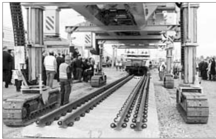
Строительство Rail Baltica обойдется примерно в 3,5 миллиарда евро. Если скоростной поезд запустят, то из Таллинна до Варшавы можно будет добраться менее чем за пять часов.

"Направленные на Евросоюз инвестиции помогут создать рабочие места там, где до сих пор его не было", — подчеркнул президент Еврокомиссии Жозе Мануэль Баррозу.