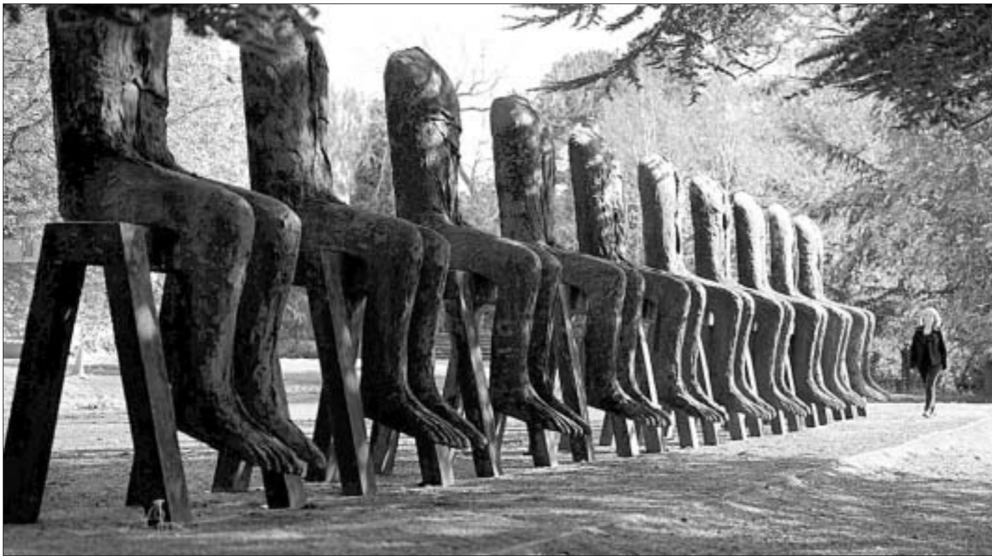
"10 фігур, якія сядзяць" — работа польскага скульптара Магдалены Абаканавіч. Яны сталі часткай пастаяннай экспазіцыі ў Парку скульптур.