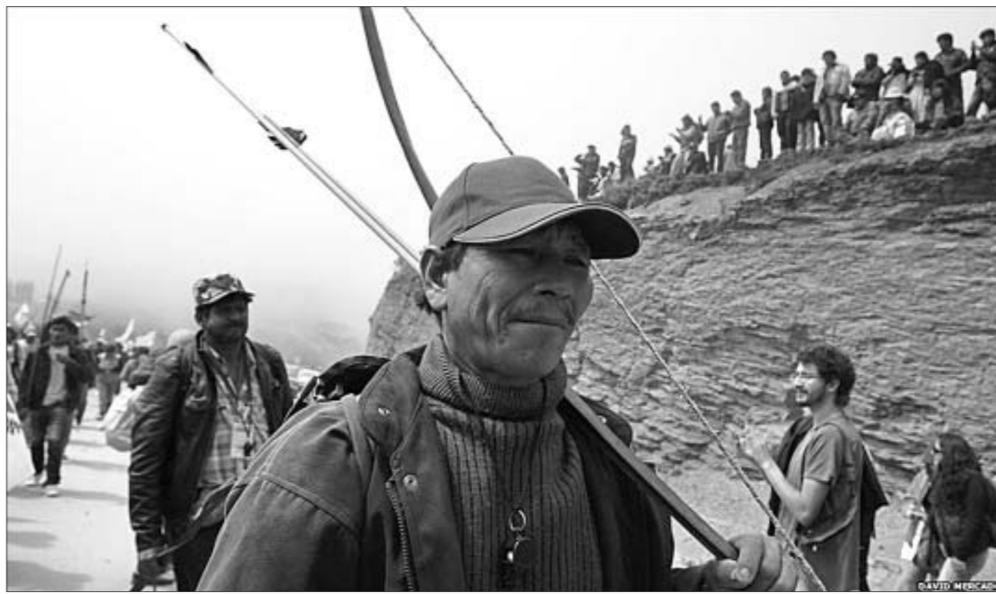
Баливійскія індзейцы на дэманстрацыі супраць плануемага будаўніцтва аўтамагістралі праз запаведнік Ісібора.