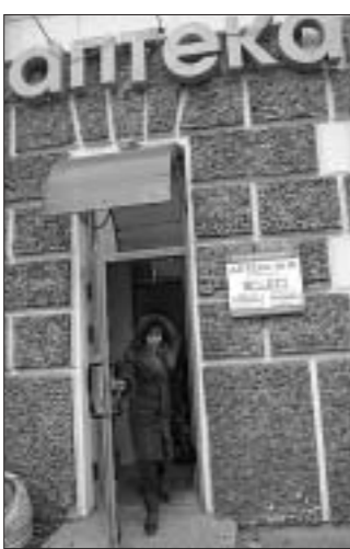
носнае, што і пацярджваюць мне ў аптэцы "24 гадзіны" на вуліцы Карла Маркса.

Як вядома, з 10 кастрычніка быў прыпынены продаж валюты на асноўнай сесіі Беларускай валютна-фондавай біржы па артыкуле "для аплаты лекавых сродкаў, вырабаў медыцынскага прызначэння". Меркавалася, што валюта на такіх мэты будзе набывацца на дадатковай сесіі па значна больш высокім курсе. Што гэта азначала? Калі, напрыклад, раней імпарцёры лекавых сродкаў набывалі валюту па курсе Нацыянальнага банка (на учарашні дзень — 5765 рублёў за доллар), то зараз ім неабходна было б рабіць гэта па рыначным курсе (на 13 кастрычніка — 9010 рублёў за доллар). Гэта амаль у паўтара раза больш, таму натуральна, што ўверх пайшлі б і кошты на імпартныя лекі. А што зараз адбываецца ў аптэках?