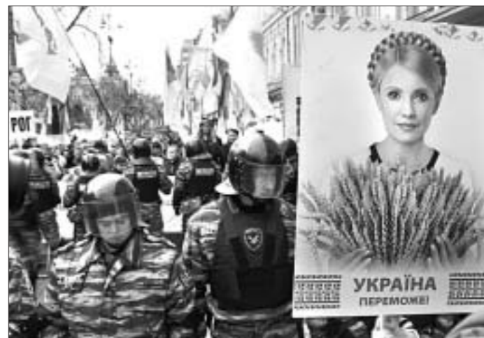
что суд не соответствовал международным стандартам справедливого и независимого разбирательства. От имени Евросоюза судье-преследователю Юлии Тимошенко в очередной раз было названо "политически мотивированным". В заявлении подчеркивается, что обвинительный приговор окажет негативное воздействие на отношения Украины и ЕС. О "последствиях" подобного рода сказано также и в соответствующем документе, обнародованном внешнеполитическим ведомством Германии.

Юлия Тимошенко, говоря одновременно с судьей, с возмущением отметила, что приговор в отношении нее — это "возврат Украины в 1937 год". Она заявила, что вынесенный вердикт — признак авторитаризма в Украине. "Никакой авторитарный режим и его приговор меня не остановят. Суд продемонстрировал, что растоптана Конституция и правосудие", — добавила Тимошенко. "Я призываю вас к борьбе. Сейчас очень тяжелый и ответственный момент. Нам необходимо защитить Украину от авторитаризма. Не опускай-