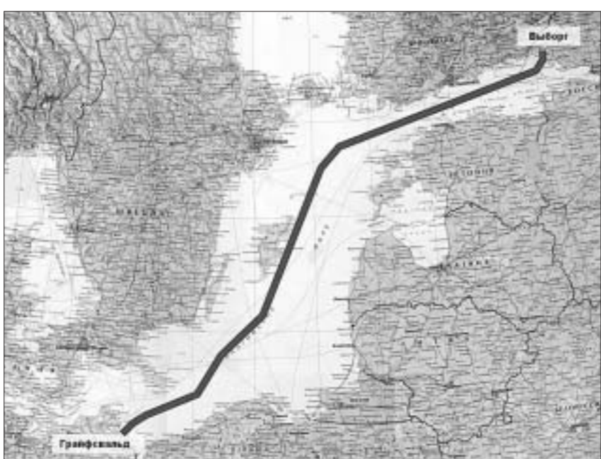
зависимость от Украины — через нее проходит примерно 70 процентов российского транзита газа. Соответственно, эта страна имеет большой рычаг давления на "Газпром". Мы уже видели перебои с поставками, а это очень негативно отражается на "Газпроме", на доле российского газа в Европе. Поэтому