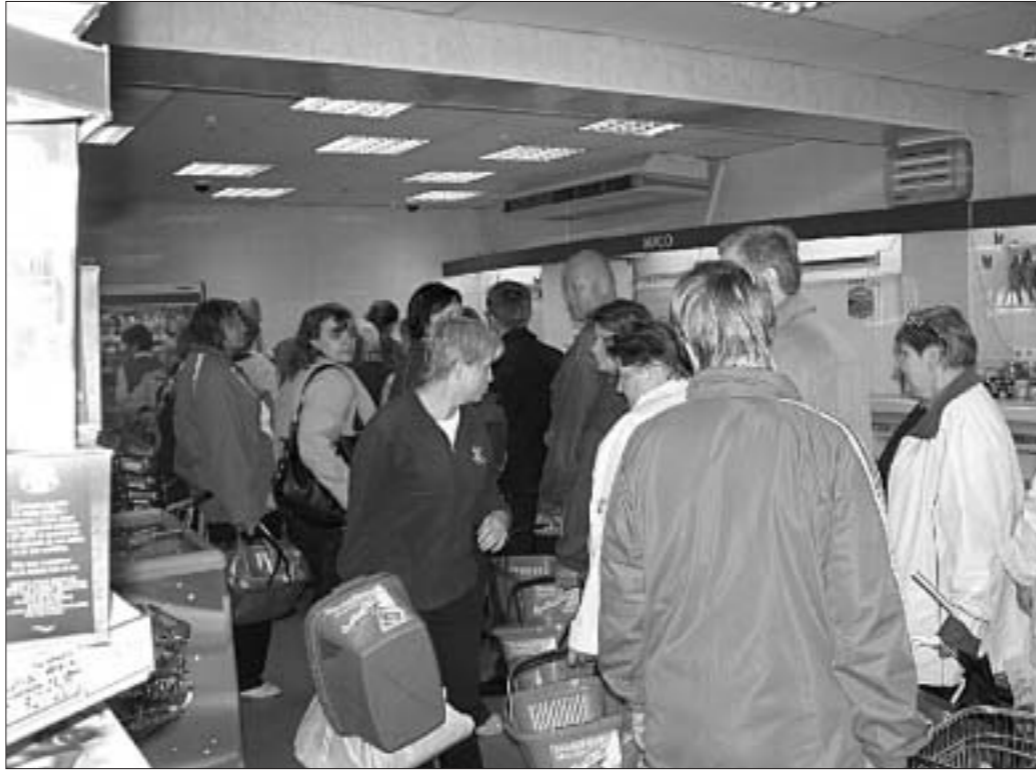
еца ў прадаўшчыцы сухенькая, як атожылак, бабуля. "Пакуль няма, — адказвае тая, — можа, будзе бліжэй да сярэдзіны дня..."