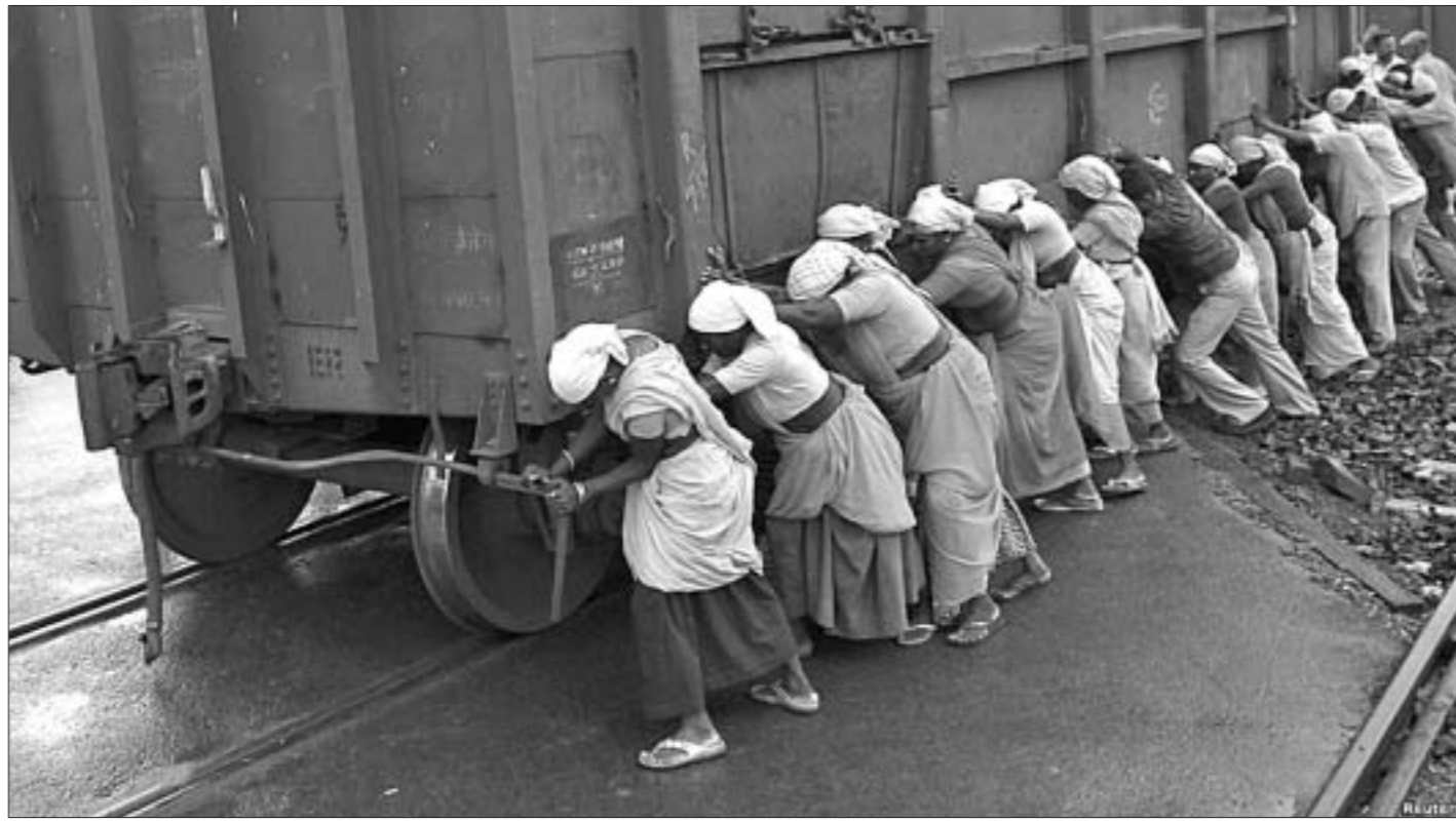
У индийским горадзе Ахмедабад шэць вагонаў сышлі з рээк, і супрацоўнікі чыгуначнай станцыі ўсе разам паставілі іх на месца.