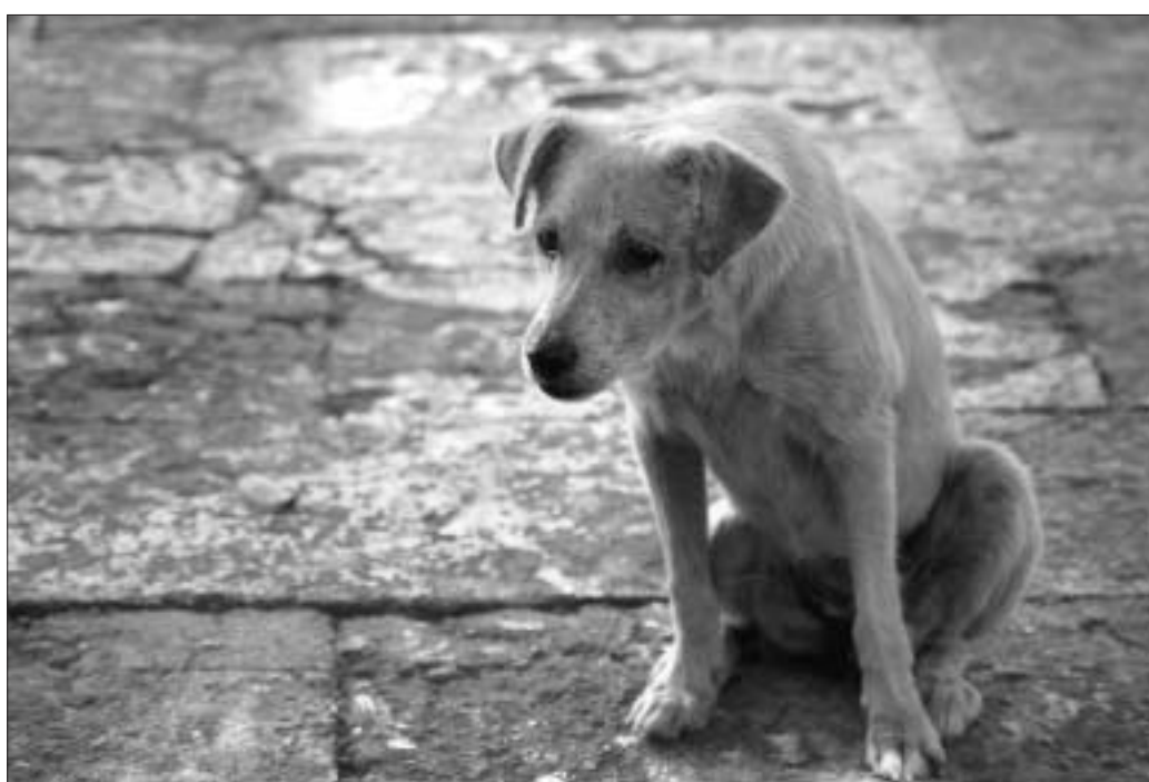
регистрации там, на собак существует налог. Если хозяин хочет зарегистрировать собаку потенциально опасной породы, то он должен предоставить справку о том, что прошел специальные курсы».