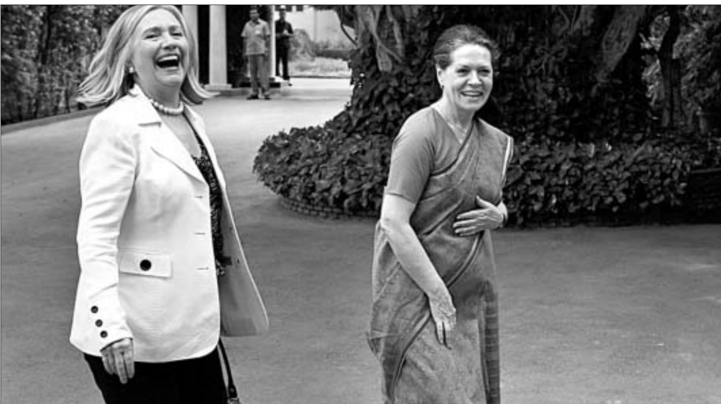
Госсекретарь США Хиллари Клинтон рада встрече с лидером индийского Национального конгресса Сонеи Ганди. Она сказала, что США окажут всестороннюю поддержку Индии в борьбе с терроризмом. 13 июля в Мумбаи снова произошел теракт, унесший десятки жизней.