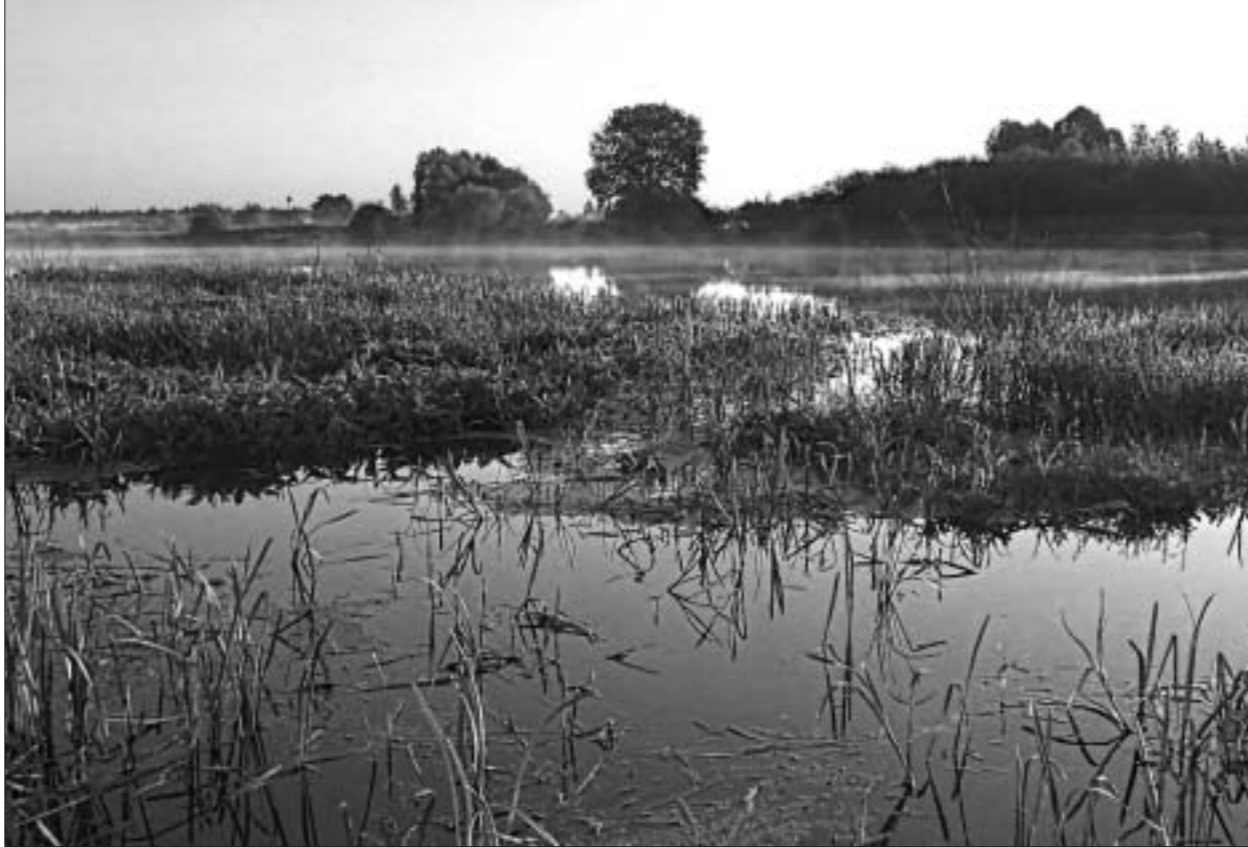
Торф здесь не уместен

Что еще важно: восстановление поддерживает население, — отмечает Михаил Амельянович. — Потому что появились туристические маршруты. Возобновились рыбалка, охота, на болотах появились ягоды.