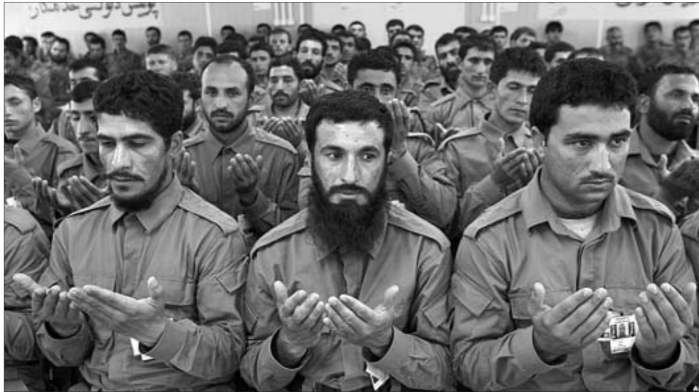
Будучыя афганскія паліцэйскія моляцца на цырымоніі выпуску ў цэнтры падрыхтоўкі паліцэйскіх паблізу Кабула.