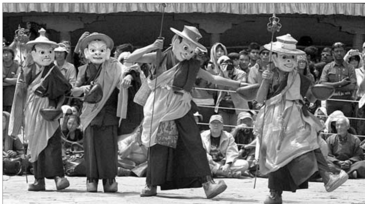
Хеміс Гомпа — старэйшы і буйнейшы манастыр у Індыі. Манахі танцуюць у масках багоў і злых духаў. Так яны адзначаюць заключны дзень фестывалю, які праводзіцца ў гонар гуру Падмасабхавы.

одержимым политикой, которая была для него безусловным приоритетом над женой и детьми. Несмотря на ум и знание нескольких языков, ее немногословность на публике, светлые волосы и консервативный стиль в одежде принесли ей пренебрежительные прозвища, такие как "кукла Барби", "тупая блондинка". Ханнелоре Коля покончила жизнь самоубийством из-за мучившей ее аллергии на свет. Ее состояние было настолько тяжелым, что с 1998 года она целые дни проводила за зашторенными окнами, выходя на улицу только ночью.