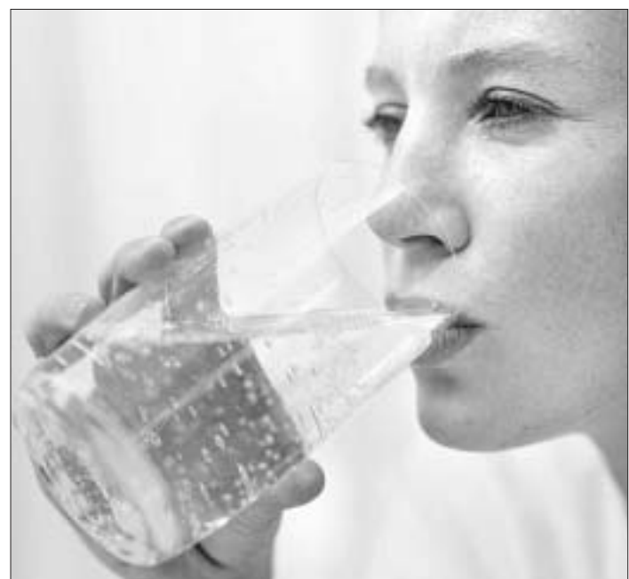
Зараз вельмі шмат матэрыялаў друкуецца пра якасць пітной вады. Кажуць, з калодзежаў ваду піць нельга, бо ў ёй нітраты. Прачытаў таксама, што "хвароба" водаправаду — іржа, павышаная колькасць жалеза. Дык можна ці не піць ваду з-пад крана?