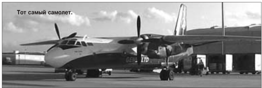
Тот самый самолет.