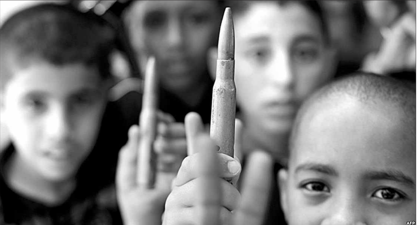
В одной из школ в ливийском городе Бенгази детям раздают игрушечные пули, для того чтобы они не играли с настоящими.

Девять человек погибли в афганской провинции Нангархар на востоке страны в результате стрельбы, устроенной неизвестными боевиками.