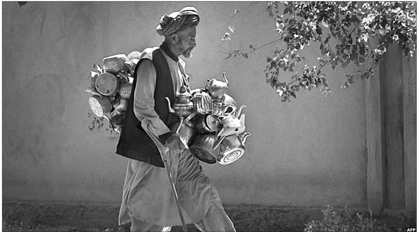
Кабульскі торговец чайнікамі і посудай отправляецца на месцны рынок.

— Ягоўнае, дакрышчца... Віталь ГАРБУЗАЎ.