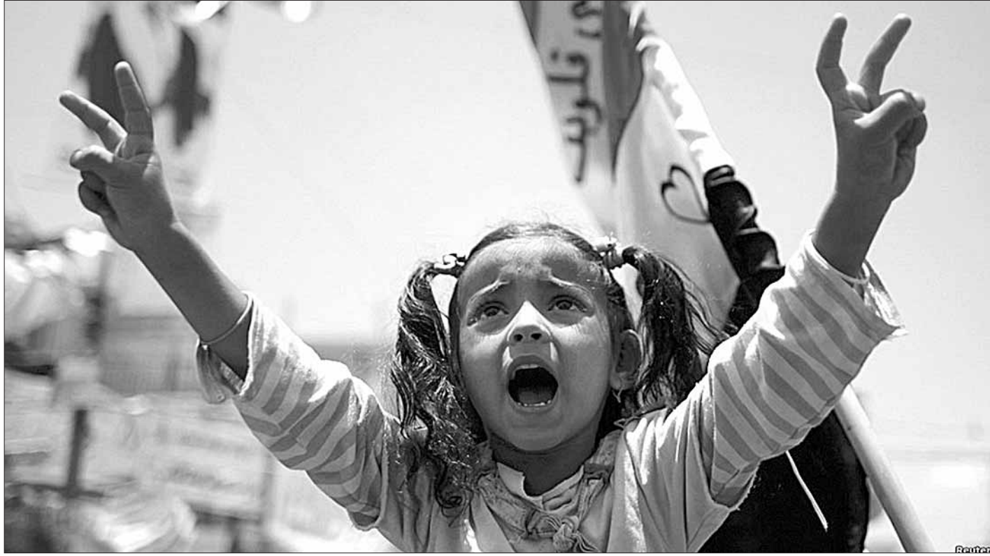
В столице Йемена Санае продолжаются протесты, на которых демонстранты требуют отставки президента Али Абдуллы Салеха.

Вчера Торнадо обрушился на город Спрингфилд (штат Массачусетс). В результате четыре человека погибли, десятки получили ранения, повреждены сотни домов, передает CNN.