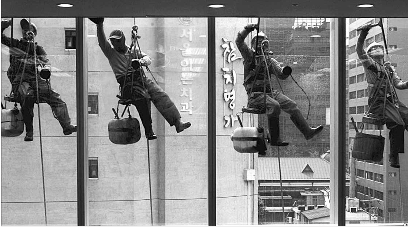
В Сеуле — обычный рабочий день.

Специалист советует временно отказаться от употребления овощей в местах общест-