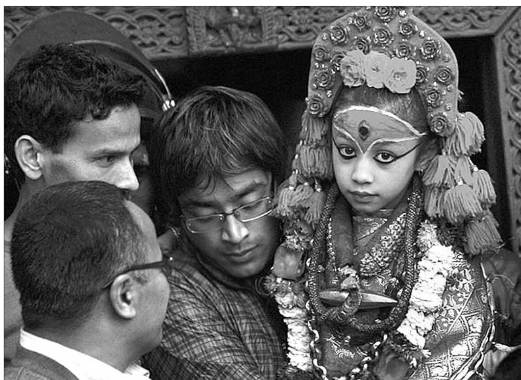
Релігійнае свята ў Непале.

Одни считают, что это была некая секретная операция на головном мозге, которая не освещалась ранее. Другие утверждают, что здесь не обошлось без вмешательства инопланетян. Белый дом отверг все эти предположения, назвав их "смехотворными".