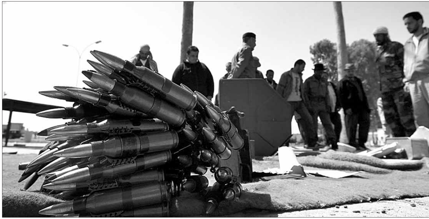
У лагеря лівійських паўстанцаў у Бенгазі.