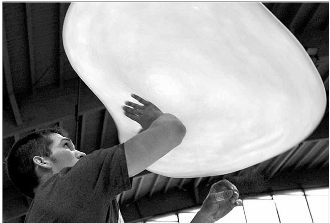
Чемпіонат світу по прыгатуванні піци.

Ранее за коррупционные преступления уже был взят под стражу или домашний арест целый ряд бывших высокопоставленных чиновников, в том числе бывшие министры финансов, туризма, жилищного строительства, информации, а также глава МВД и один из ключевых сотрудников администрации Мубарак — глава его канцелярии Закария Азми.