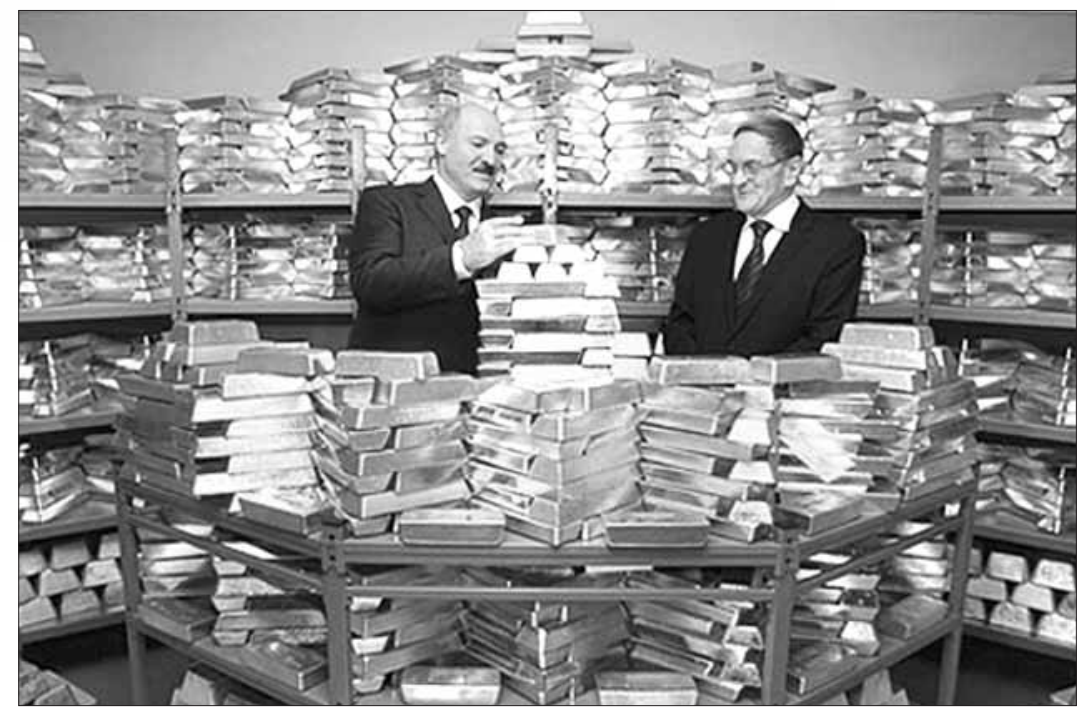
А Лукашэнка і Прапаковіч так рэкламіравалі залаты запас краіны!

На 1 сакавіка 2011 года золатавалютныя рэзервы Беларусі склалі 4 мільярды 23,6 мільёна долараў супраць 5 мільярдаў 30,7 мільёна на 1 студзеня. Такім чынам, за два месяцы золатавалютныя рэзервы знізіліся на 1 мільярд 7,1 мільёна долараў, або на 20 працэнтаў.