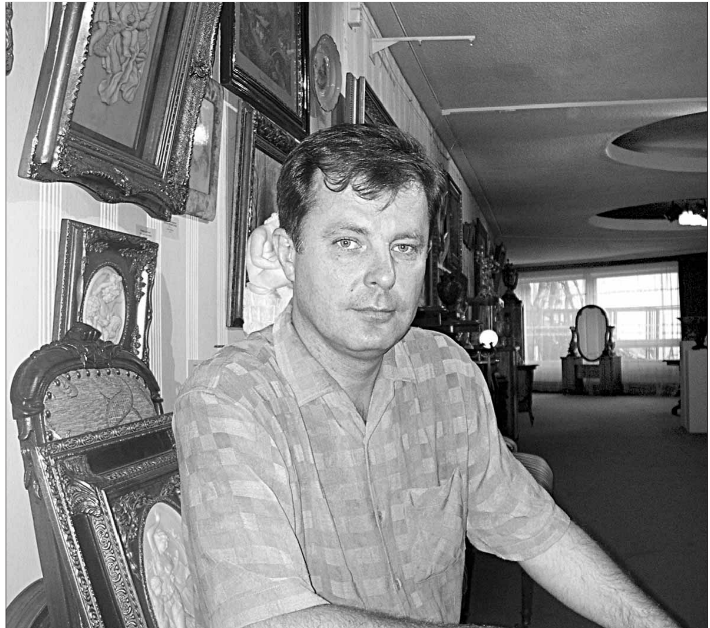
коллекционеры хранят свои богатства? Вы говорите, банк не берет... Просто под замком?

25 вопросов директору аукционного дома, который верит в любовь к искусству, но не верит, что с арт-рынка когда-нибудь исчезнут подделки