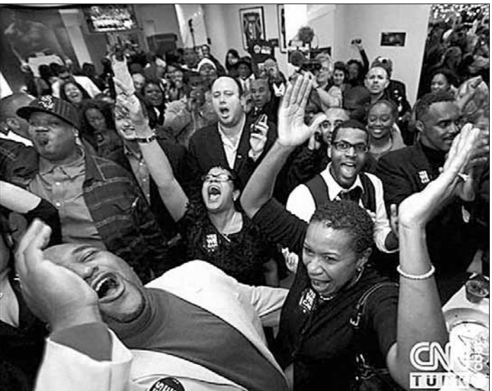
А это уже картинка из Украины. Странники Януковича празднуют его победу.

Мы ставим широкую задачу: казахский как государственный язык, объединяющий всех казахстанцев, должен стать духовной потребностью каждого гражданина. Это вопрос престижа.