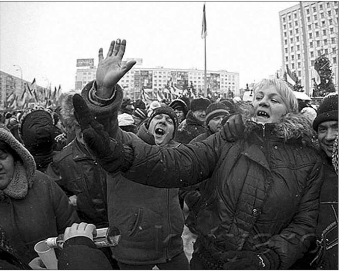
Уж на что Уго Чавес — ... (нужное вставить), но и его успехи приветствуют многотысячные толпы. То есть ясно, что есть люди, которые голодовали за это ответвление эволюции и которым его победа доставила радость.