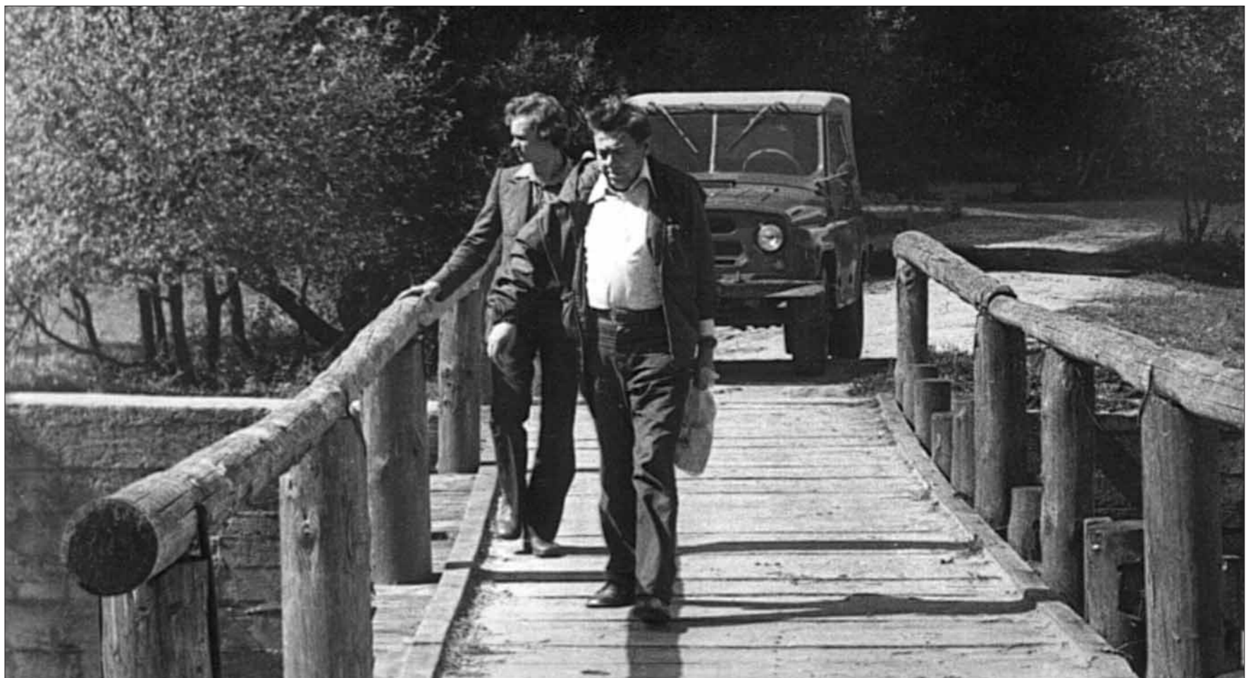
Уладзімір Караткевіч і яго жонка ў вяснянае надзеянне ў вёсцы Збароў, 1930-я гады.

І яшчэ за адну рэч я ўдзячны тым гадам. Здалёку я асабліва любіў Беларусь і яе людзей. Яна ўвайшла мне тады па незямному прыўкрашэнню. Уся зялёная, вільготная, з азёрамі, з народам, з зягонай півнучай і звонкай мовай, з легендамі і палямі, курганамі і рэкамі.