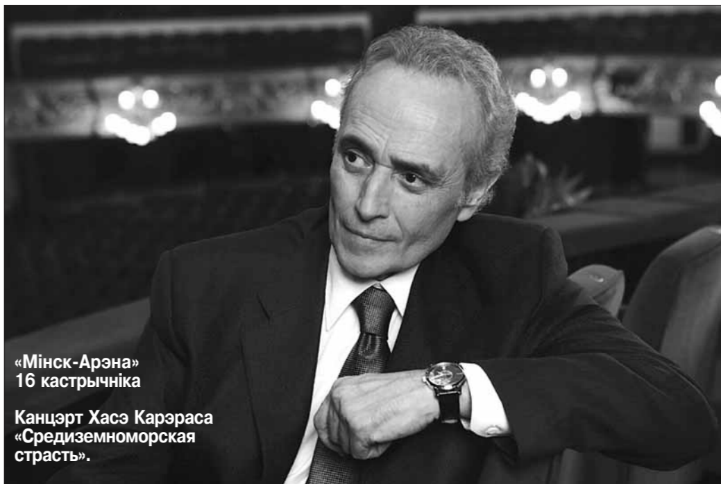
«Мінск-Арэна» 16 кастрычніка Канцэрт Хасэ Карэраса «Средиземноморская страсть».

12 — "Не бойся быть счастливым". 13 — "Три поры и одна судьба". 14 — "Женщине не запрещать...". 15 — "Перезагрузка".