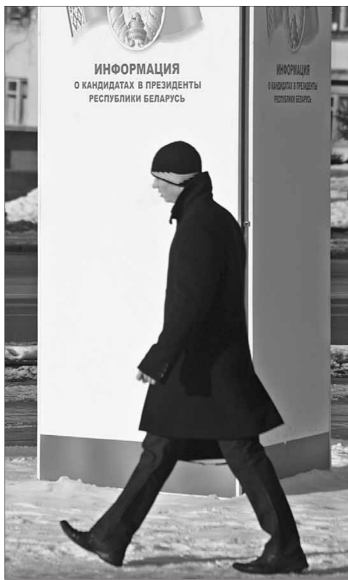
Быў 2006 год, а што прынясе 2010?