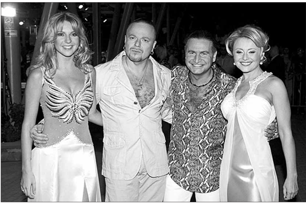
21 мая, Мінск, Палац Рэспублікі "Гісторыя каханьня", канцэрт Анжалікі Варум, Леаніда Агуціна, Наталлі Падольскай і Уладзіміра Праснякова.

Профилактика до 11.05. 11.05, 12.05, 23.05, 00.05 "Вариант "Омега". Сериал. 12.00, 13.00, 14.00, 15.00, 16.00, 17.00, 18.00, 19.00, 20.00, 21.00, 22.00, 23.00, 00.00, 01.00 "Новости Содружества".