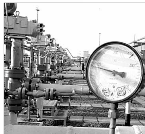
«Давайце тады так зробім: з улікам таго, што мы гэтак пытанне абмяркоўвалі ў партнёрскім рэжыме. Дадзім п'яцідзённы тэрмін для нашых калег для таго, каб яны вызначыліся, як весці сябе далей. Прапануючы ім у самую кароткую тэрмін пагадзіць запазычанасці. А калі гэта не будзе зроблена, тады дайдзешца прымяняць іншыя меры», — выразыў Мядзведзеў.

Доўг Беларусі ў гэтым годзе склаў ужо каля 200 мільёнаў долараў. Расійскі бок заяўляе, што афіцыйны Мінск у аднабаковым парадку працягвае плаціць за пастаўлены газ па цэнах 2009 года. У Беларусь у сувязі з гэтым былі накіраваны два афіцыйныя лісты. Аднак дагэтуль няма яснага адказу, калі гэты доўг будзе пагашаны. Падчас сустрэчы з Мядзведзевым кіраўнік «Газпрома» Аляксей Мілер патлумачыў, што адпаведна з умовамі кантракта ў расійскага боку «ёсць усе падставы скараціць аб'ём пастаўкі газу ў Беларусь прапарцыянальна запазычанасці».