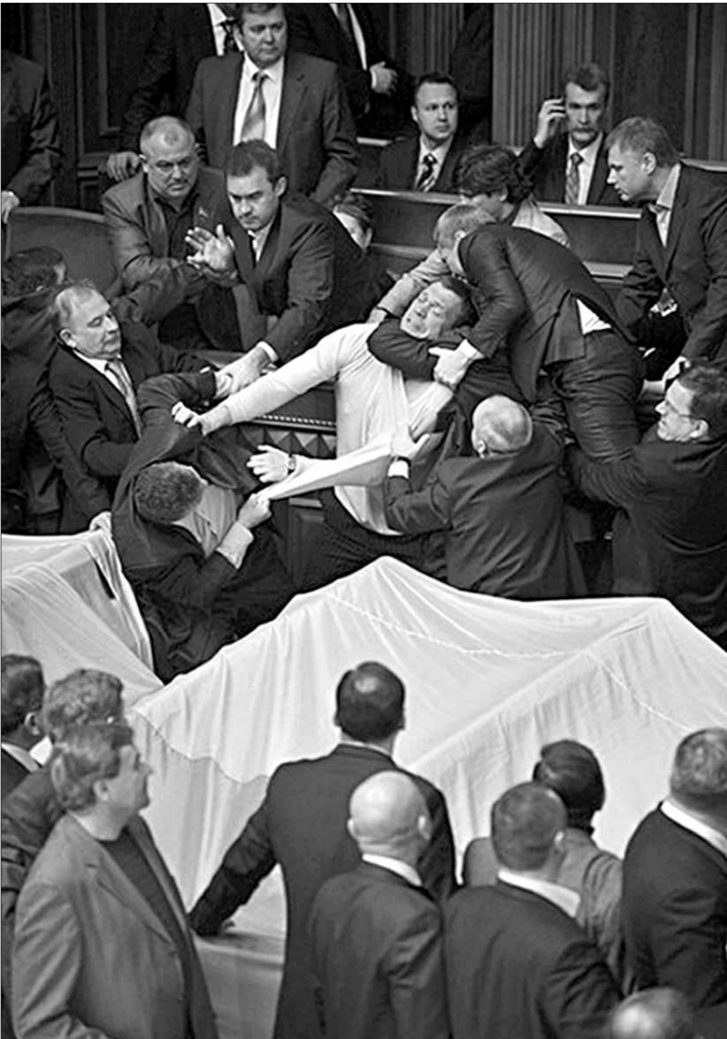
Вот так украинские депутаты сражаются за независимость...