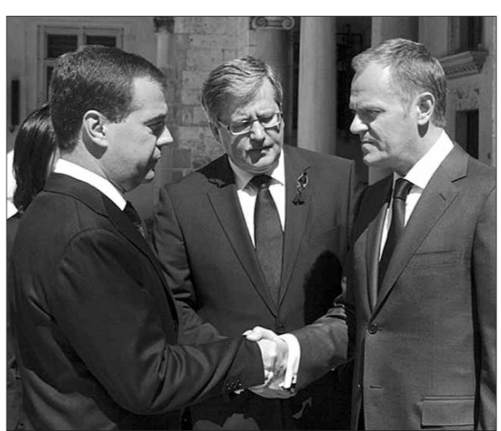
а также, например, Эстонии или Украины и даже Грузии", — считает Бжезинский.

"Если это [примирение] наступит, то в геополитическом плане это можно сравнить с польско-немецким примирением, а еще ранее — с немецко-французским. Это бы изменило карту Европы. Это увеличило бы безопасность не только Польши,