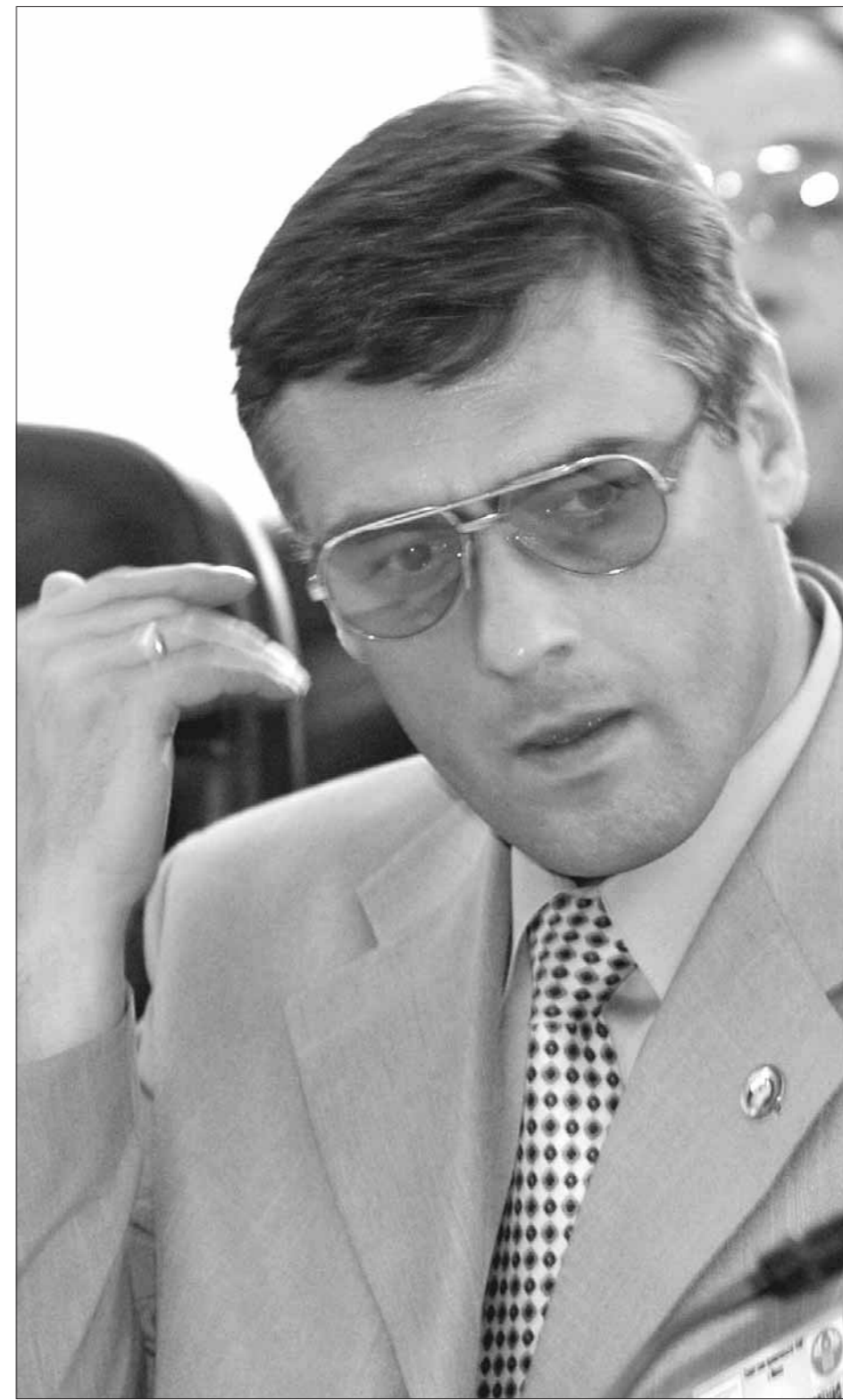
...тень бывает. Имя ему — Господь Бог. А кто на земле Богом стать вознамерился, так тот сам из тьмы. Не от Бога тот...”

“Сегодня я не верю ни одному слову президента, а вы еще надеетесь на него. Его тень уже стоит между нами. Но знайте, что, как это было в тридцатых, Павликом Морозовым я не стану...” “Вдумайтесь — зачем он со своей пропагандой каждый день встречается между родителями и детьми, мужьями и женами, за чем он хочет для всех быть отцом — “Батькой”, зачем ему нужны наши души? Может, вы над этим и не размышляли, но для человека верующего только один всеобщий отец-созда-