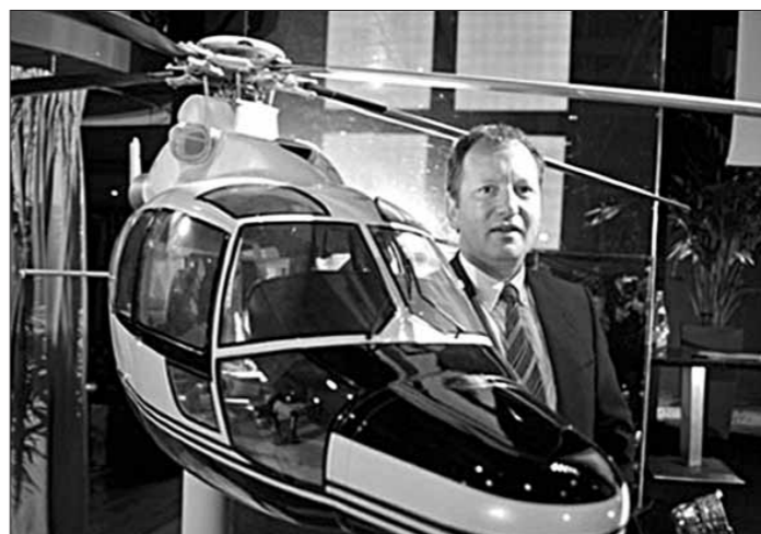
Глава европейской фирмы на вытворчасці верталёту Eurocopter дэманструе мадэль новай распрацоўкі сваёй кампаніі.

новое правило вызвало волну горячих обсуждений в китайском сегменте интернета. Многие пользователи напоминают о том, что употребление в пищу мяса собак и кошек является давней кулинарной традицией отдельных регионов Азии. Защитники животных, любители собак и кошек, выступают с прямо противоположными заявлениями. Периодически китайские СМИ публикуют информацию о том, что в отдельных регионах страны любители животных спасли сотни котов, предназначенных для продажи в рестораны.