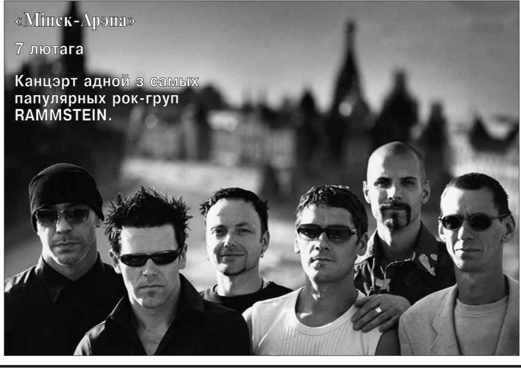
«Мінск-Арэна» 7 лютага

Нацыянальны акадэмічны драматычны тэатр імя Я.Коласа 2 — "Эн. Яна. Акро. Нябожчык".