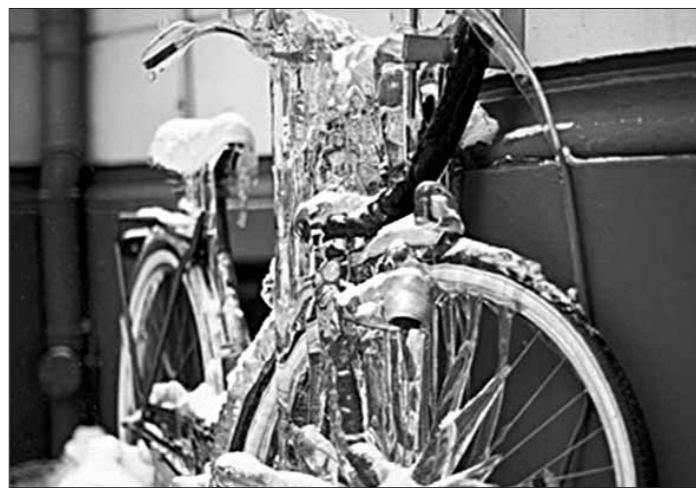
Такім знайшоў зранку свой веласіпед адзін з жыхароў Варшавы.