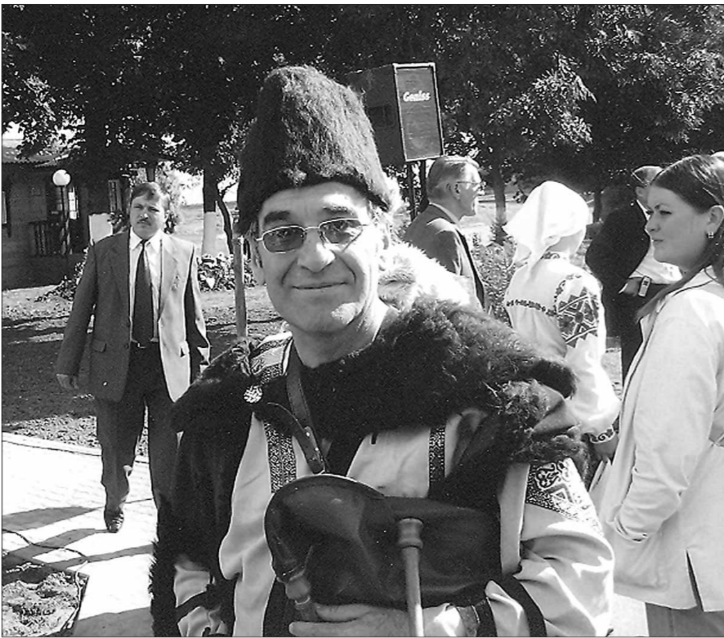
Такім ён застаўся ў памяці беларусаў...

Згадаваў даўні, сумнакур'ёзны эпізод. У праграме агляду самадзейных калектываў аднаго з раёнаў значыцца і калгасны хор даяраў. Ведала тых галасістых, дасціпных, вясёлых кабет, якія ператваралі звычайныя вачоркі ў вясковы клубік у яркае свята для ўсяго наваколля. А з чым іх прыслалі на агляд? Глядзела лістак з рэпертуарам, зацверджаным аддзелам культуры і само сабою, партыйным райкамам, чытала назвы прызначаных для выканання песень — і дзіву давалася. Іх значылася