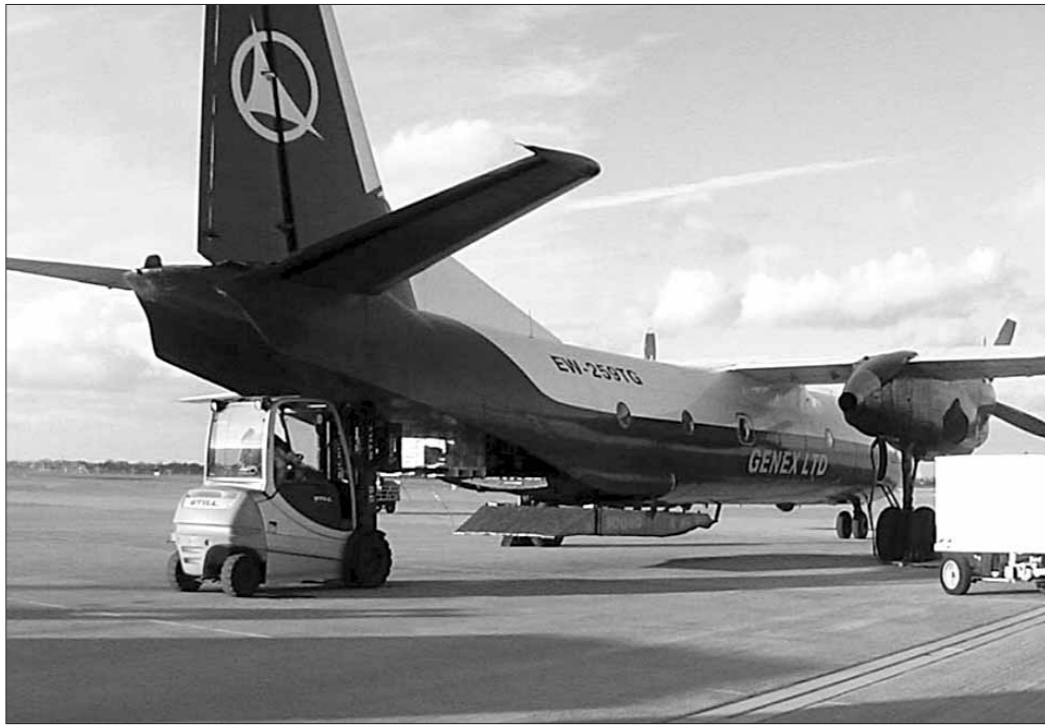
Самолет Ан-26Б ООО "Генекс".