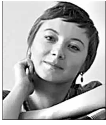
"Фабрыкі слёз" самы аўтарытэтны літчасопіс Амерыкі The New Yorker.

Літаратурная прэмія Фундацыі Лэнэна (Lannan Literary Awards) — серыя ўзнагарод і стыпендыяў, заснаваная ў 1989 годзе, якой штогод уганароўваюцца як вядомыя, так і маладыя "аўтары надзвычайных літаратурных якасцяў, якія зрабілі значны ўнёсак у англійскую моўную літаратуру і вымаўляюць патэнцыял для далейшай яскравай працы".