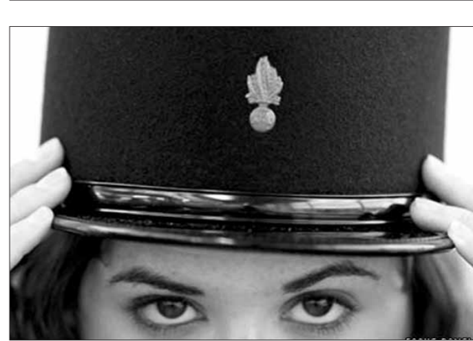
У Лондане рыхтуюцца да распрадажы касцюмерных рэчаў. На ёй можна набыць касцюмы, якія бачылі ў кіно і тэатральных пастаноўках.

лышали наконец от руководителя "о кэй". Но, видимо, филигранный процесс репетиций заразил их настолько, что скрипачи и во время перерыва подходили за разъяснениями. Естественно, что на концерте дисциплина дала свои результаты: "Молодая Беларусь" звучала ясно и точно. — Как вы думаете, сегодня в мире больше хороших оркестров или хороших дирижеров? — поинтересовалась я у маэстро Наварра, уличив свободную минуту в его графике. — Лучший вопрос. Но отвечу так: оркестров больше. — О чем расспрашивали вас дома товарищи, когда вы впервые посетили Беларусь? — Вокруг меня музыканты, поэтому их интересовало, есть ли хорошие залы в Минске, и вообще, сколько театров, какая архитектура преобладает в городе (я отвечал, что преобладают здания с множеством колонн)... Слово за слово, перешли на общие темы. "Что такое успешный музыкант?" — рассуждал г-н Наварр. — Это человек, заставляющий публику забывать о времени". Что говорить, ради этой великой иллюзии человек и посвящает свою жизнь искусству... Кстати, накануне концерта в Академии музыки маэстро Наварра принял министр культуры Павел Латушко. Разговор шел на трех языках: белорусском, французском и русском. Говорили о самом актуальном: о будущих творческих контактах между двумя странами. Также важный аспект, которому не жаль, по-моему, посвятить жизнь. Елена МОЛОЧКО.