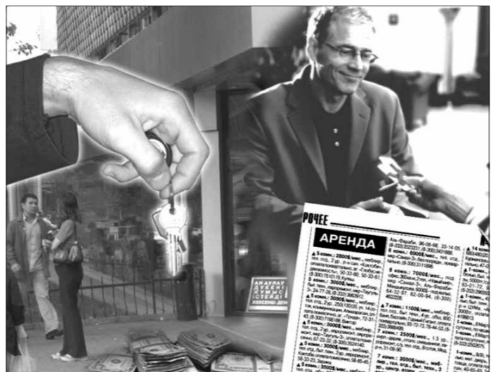
В колледже есть списки студентов, которые живут на частных квартирах, адреса и фамилии хозяев. Почему нельзя заставить их заключить договора? Ведь если получается у нас конфликты с хозяевами, то можно будет сослаться на договор, где прописаны все условия.

Уважаемые журналисты "Народной Воли"! Пишут вам учащиеся Несвижского педагогического колледжа. Дело в том, что большинство из нас живет на частных квартирах.