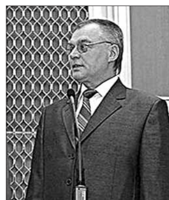
нужны только время и забота...